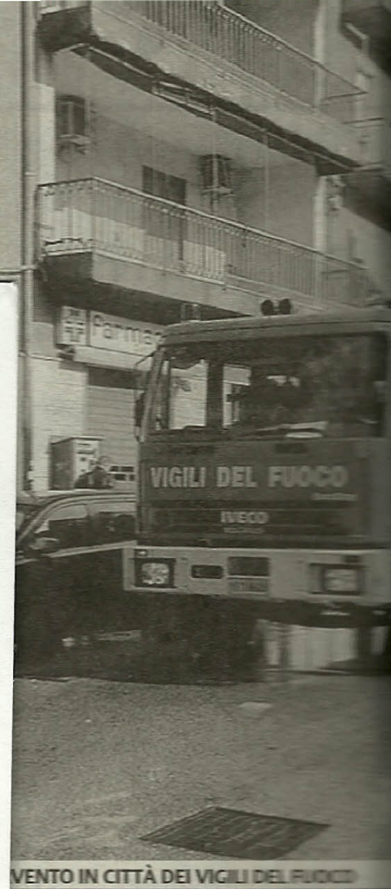
VENTO IN CITTÀ DEI VIGILI DEL FUOCO

«CIAO ONLUS» DOMANI ALLE 18 A VILLA REIMANN