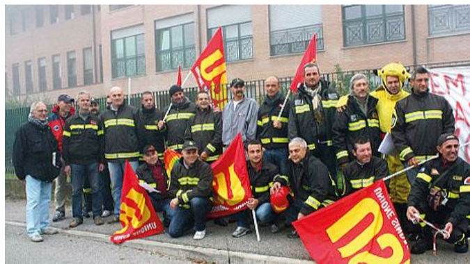
Il presidio dei vigili del fuoco aderenti allo sciopero dell'Usb e il travestito da cavia davanti all'ingresso del comando di via Verga-via Chailly

«Noi umili lavoratori "cavie" vorremmo solo avere una maggiore considerazione in quanto lavoratori e non più essere utilizzati come cavie». I vigili del fuoco appartenenti all'Usb ieri mattina hanno presidiato l'ingresso del comando di via Verga, in occasione della giornata di sciopero generale indetta dal sindacalismo extracconfederale. Motivazioni nazionali come il no al governo delle larghe intese e alle politiche di austerità alla base della