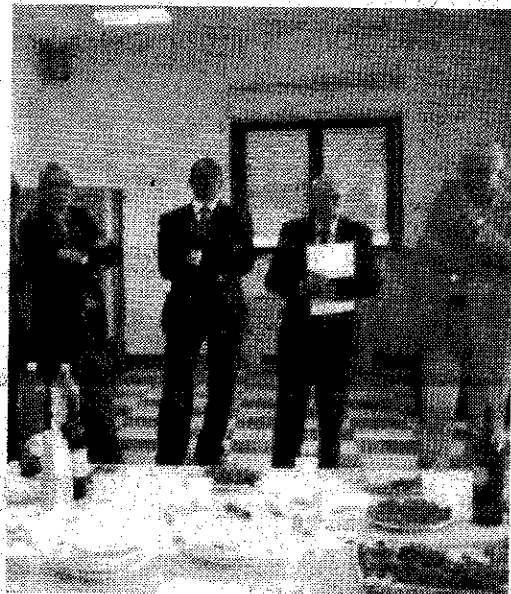
Due momenti della visita del ministro degli Interni alla nuova sede dei vigili del fuoco di Orbetello