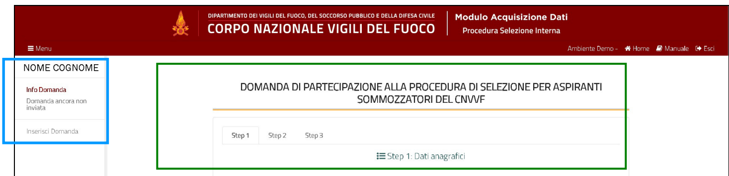
Figura 4 - Home page dopo l'accesso

Sezione con le info della domanda e le funzionalità