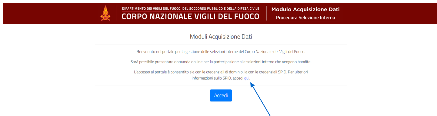
Figura 1 - Home page della piattaforma

L'applicativo è raggiungibile, solo dalla rete dipartimentale, all'indirizzo http://moduloacquisizionedati.dipvvf.it .