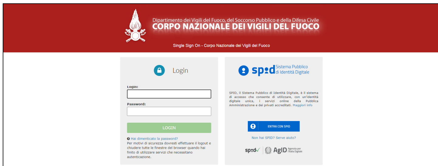
Figura 2 - pagina di autenticazione

Il sistema presenta la schermata di autenticazione del Dipartimento, che può avvenire o tramite le credenziali di dominio (inserendo nome.cognome@dipvvf.it e relativa password nella maschera di sinistra) o tramite le credenziali SPID (selezionando "ENTRA CON SPID" nella maschera di sinistra).