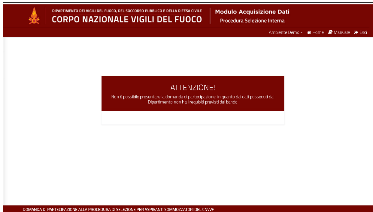
Figura 3 - Messaggio di errore per mancanza di requisiti di partecipazione

In caso contrario viene visualizzato il seguente messaggio di errore: "Non è possibile presentare la domanda di partecipazione, in quanto dai dati in possesso dal Dipartimento, non ha i requisiti previsti dal bando" .